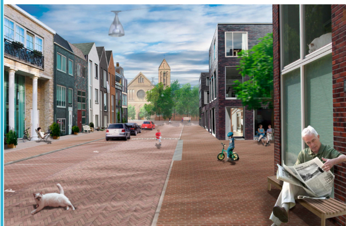
Impressie wijk Nieuwe Delft, kijkend in de richting van het Westerkwartier (artist impression bureau Palmbout)

• De spoortunnels zullen 2.300 m lang worden. De oostelijke tunnelbuis (aan de Phoenixstraatzijde) is al casco gereed en wordt nu van binnen afgebouwd. In 2015 zullen er twee sporen in gebruik worden genomen in die oostelijke buis; de ruwbouw van de tweede buis is inmiddels gestart; in 2017 zal deze casco (zonder spoor) worden opgeleverd.