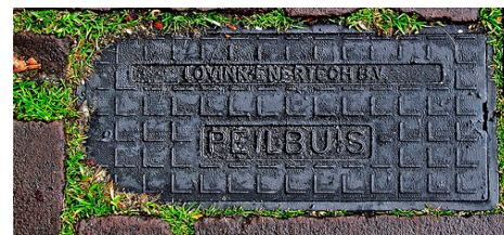
Voorbeelden van Peilbuisdeksels