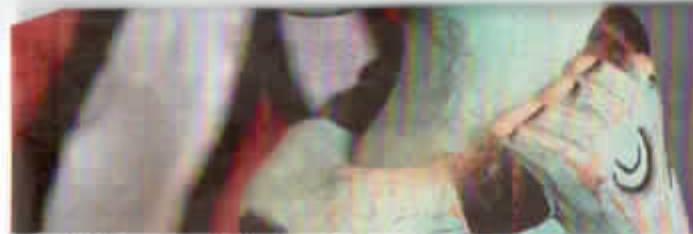
voor Delft en voor Nederland.

dige omstandigheden laten zeer te wensen over. Een geschikte huisvesting van de collectie is dringend noodzakelijk. Ook dat dient naar onze mening onderdeel van de plannen te zijn. Het bezoekersaantal is een factor die een rol speelt bij de afweging. Daarbij wijzen wij erop dat jarenlang nauwelijks een cent beschikbaar was voor marketing voor Nusantara. Ook het maken van tentoonstellingen gebeurde zonder of met zeer minimale budgetten. Om dan nu te constateren dat de bezoekersaantallen achterblijven is wrang."